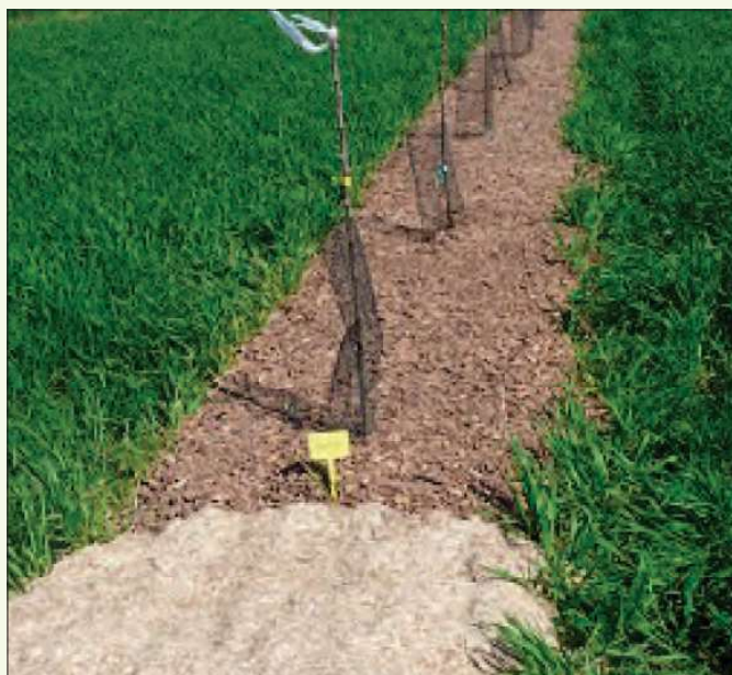
Photo 1 - Mulch d'anas de lin (premier plan) et d'écorces (deuxième plan) sur plantation de pommier à cidre.

2009 avant plantation et enterrée sur les bordures. Les mulchs ont été les plus difficiles à mettre en place car la pose n'a pas pu être mécanisée. Elle s'est donc effectuée manuellement le 24 avril 2009 sur 1 m de large en continu sur le rang. Pour chaque mulch, l'épaisseur recherchée était de 20 cm afin de garantir une bonne pérennité ; au final, l'épaisseur réelle était de 15 cm (photo 1). Après 3 ans, début 2012, les mulchs avaient presque entièrement disparu et nous avons donc semé du pâturin commun après un passage d'outil mécanique (Ladürner).