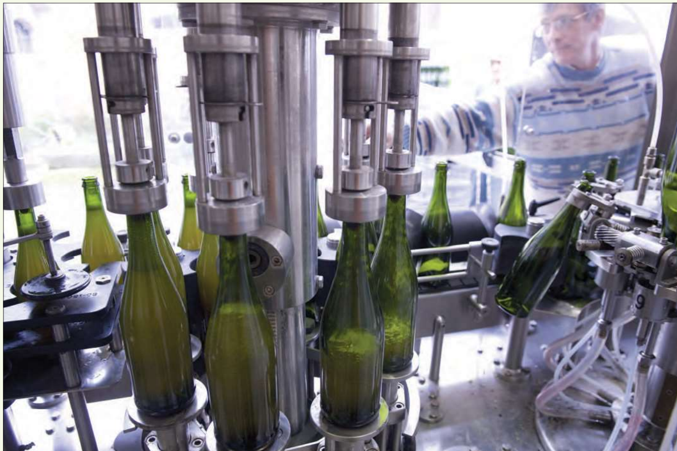
Dans la filière cidre, la mise en place d'un GBPH a été demandé par la profession et initiée en 2009 sous la coordination de l'IFPC.

départ, 23 réunions de travail ont eu lieu (2 en 2009, 4 en 2010, 6 en 2011 et 8 en 2012, 3 en 2013).